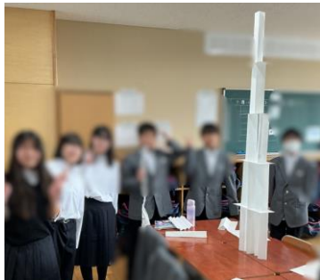
ペーパータワーの様子